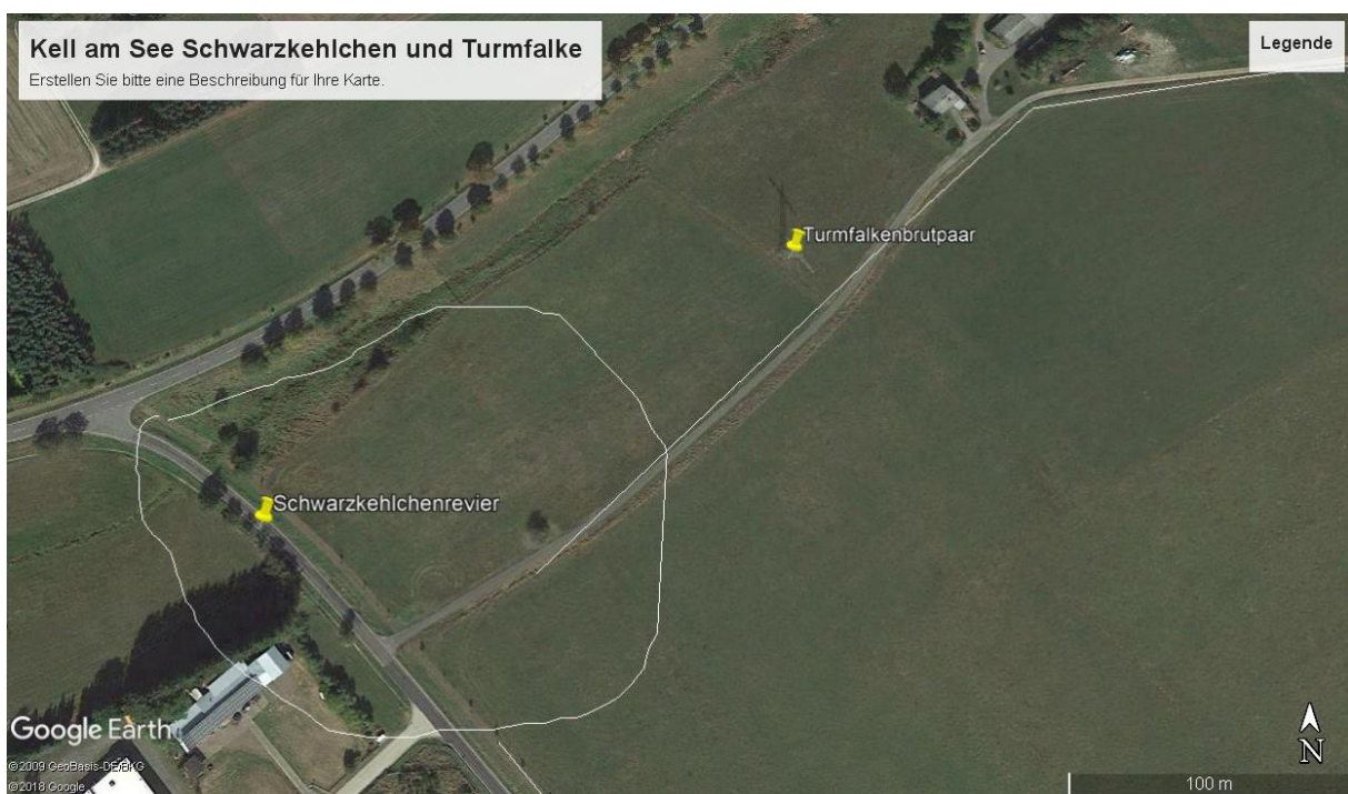
Abb. 2: Lage des Schwarzkehlchenrevier und des Turmfalkebrutplatzes