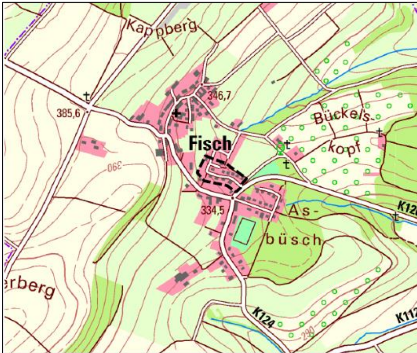
Abbildung 1: Auszug aus der Topographischen Karte mit Kennzeichnung des Geltungsbereiches des Bebauungsplanes „In Eimert“; Quelle: LANIS, Abfrage 12/2020, ohne Maßstab